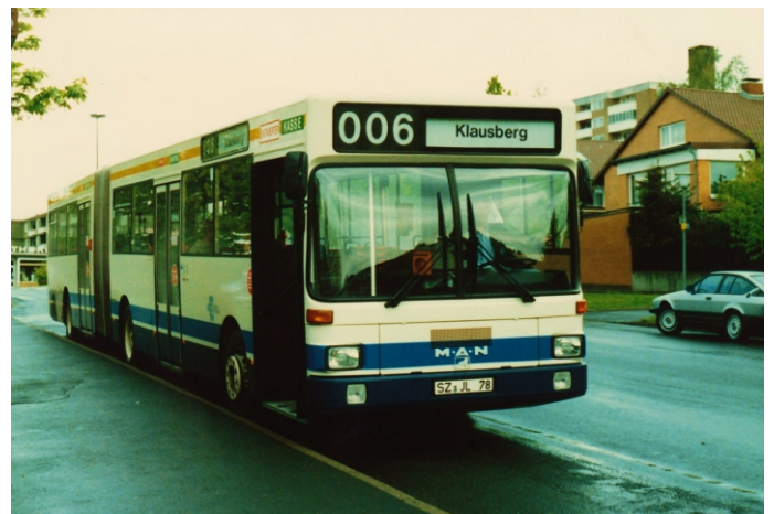
SZ-JL 78 (Holger Werner)