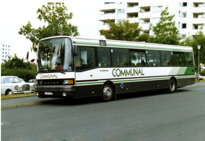
U-LM 4107 (Holger Werner)

Beim nächsten getesteten Gelenkbus kam mal wieder Setra mit einem SG 219 SL (U-LM 981) zum Zuge. Mit U-LM 4107 stellte Setra auch einen S 215 SL-Solowagen zur Erprobung bereit.