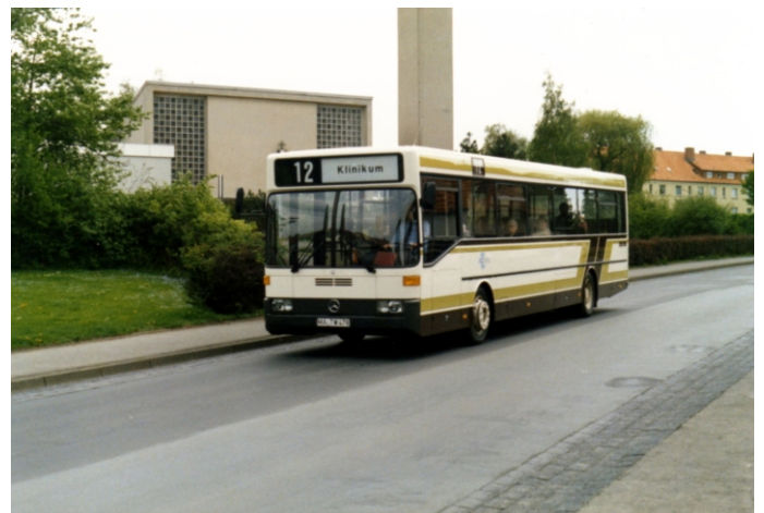
MA-TW 478 (Holger Werner)

Den Abschluß der Vorführwagen in den 1980er Jahren bildete dann wieder ein MAN. Aus Salzgitter kam ein SG 242 mit dem Kennzeichen SZ-JL 48 nach Göttingen.