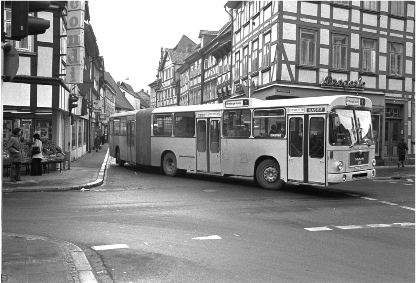
M-UU 2844 (Karl-Heinz Otto)

Mit Beginn der Standard-I-Fahrzeugegeneration testeten auch die Stadtwerke Göttingen die ersten Busse des neuen Typs. So waren ein Büssing BS 110 V, vier Mercedes-Benz O 305, ein Magirus-Deutz M 170 SH 110, ein MAN SL 192 sowie ein MAN SG 192 zu Beginn der 1970er Jahre in Göttingen zur Erprobung..