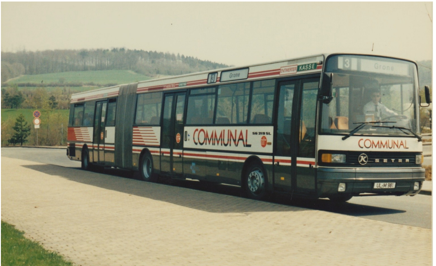
U-LM 981 (Holger Werner)

Beim nächsten getesteten Gelenkbus kam mal wieder Setra mit einem SG 219 SL (U-LM 981) zum Zuge. Mit U-LM 4107 stellte Setra auch einen S 215 SL-Solowagen zur Erprobung bereit.